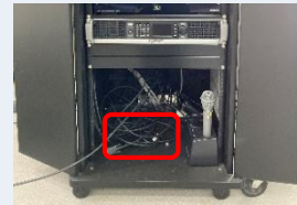
AVボックス： [HDMI]ケーブル