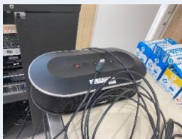
スピーカー： YAMAHA YVC-1000